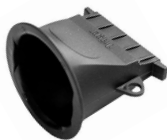
Воронка для Draeger Alcotest