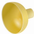
Воронка для Тигон