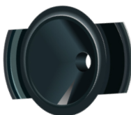
Воронка для Динго IBlow 10