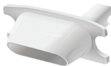
Мундштук для Alcoscan ALX3000