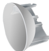
Воронка для Динго E-200 / E-200B