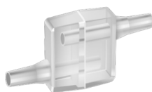
Мундштук для калибраторов