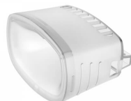
Воронка для Alcotest 5000